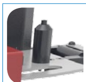
Guida di alimentazione