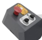
Pannello di controllo