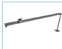
Binario taglia tubo