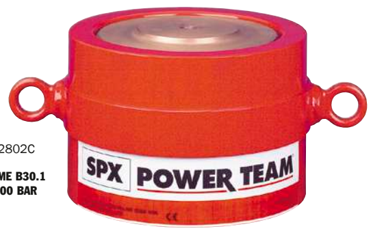
R2802C ASME B30.1 700 BAR